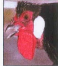
Kraaikop (zwart en koekoek)