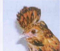
Brabanterkriel (geel-wit en goud-zwart)